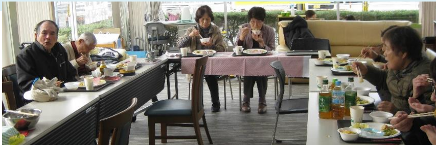
クリスマス忘年会を開催しました。