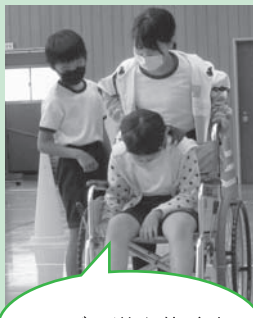
でこぼこ道を体験中