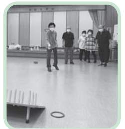
憩いの里(芸能) 吾桑さくら会(運動会)