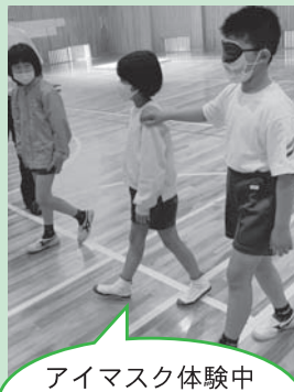
アイマスク体験中 左:見守り役 右:体験者 中央:介助者