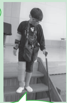
耳栓やメガネ、重りなどを装着します