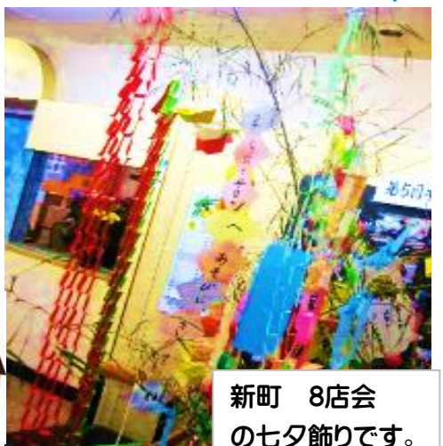
新町 8店会 の七夕飾りです。