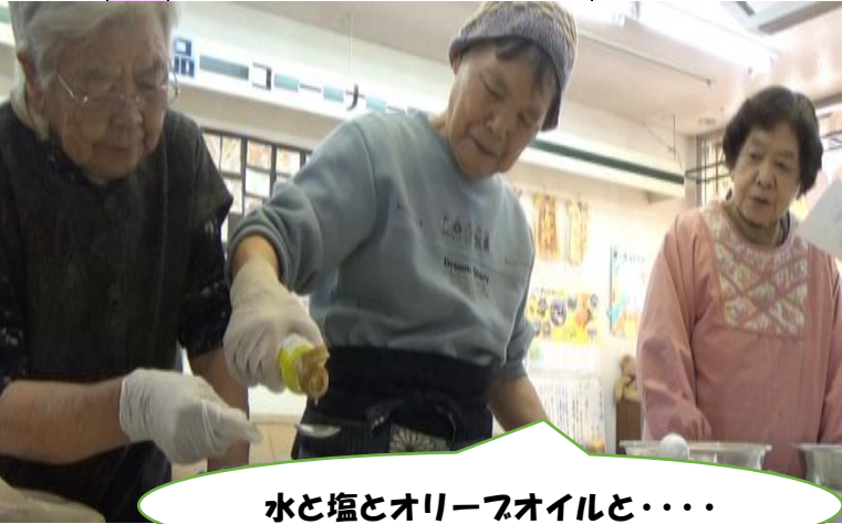
8 店会 2 度目のナン作り！