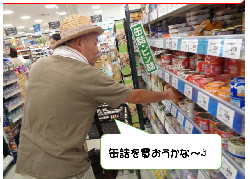
缶詰を買おうかな~♪