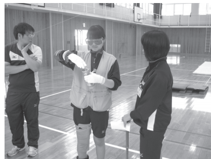
高齢者疑似体験などの様子