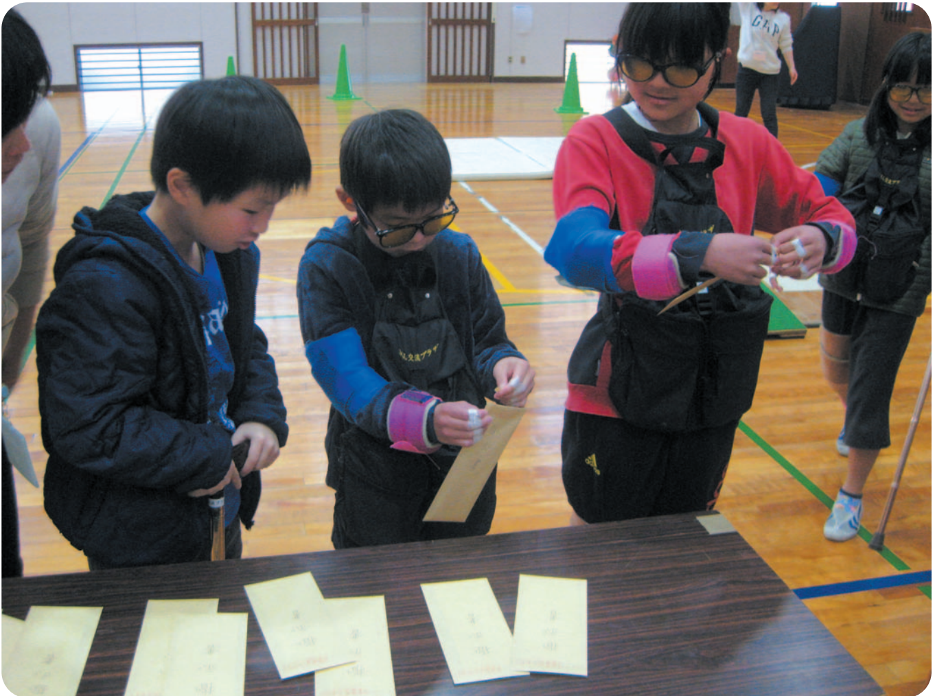
つくし君体験実施中