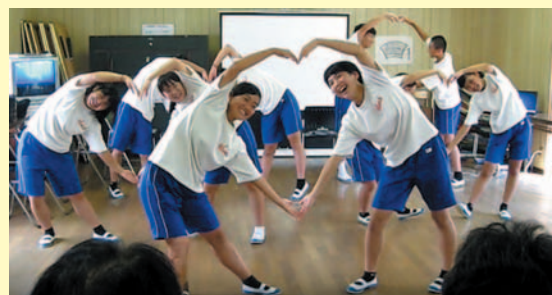
「最後の決めポーズもバッチリ!」