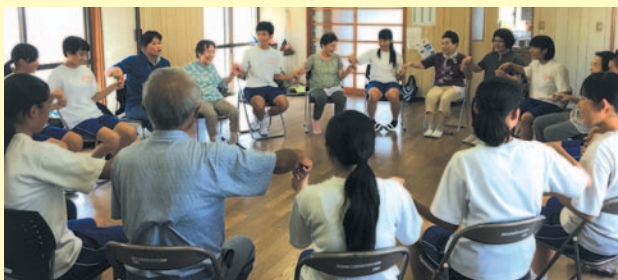
「うなぎ掴みゲームで脳活性!!」

今回の楽しい思い出と、プレゼントしていただいた「すさきがすきさ」DVDで、今回参加できなかった地域の方にも広めていき、これからも楽しく元気に介護予防を継続できそうな山手町でした。須崎中学校生徒会の皆さん、本当にありがとうございました。