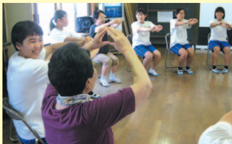
「すさきがすきさ～♪…ハートが難しい!!」