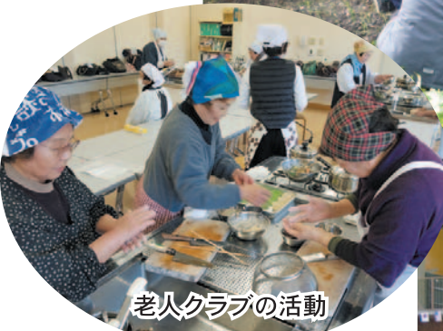
老人クラブの活動