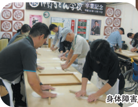
身体障害者連合会の活動