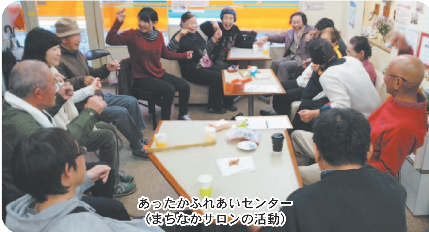
あったかふれあいセンター (まちなかサロンの活動)