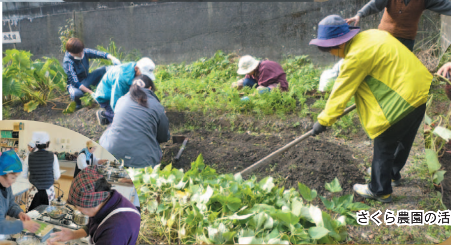
さくら農園の活動