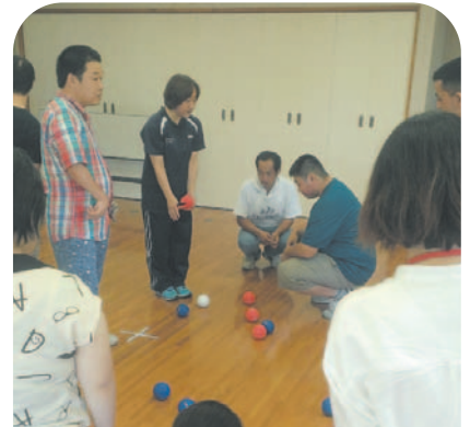
スポーツレクの活動